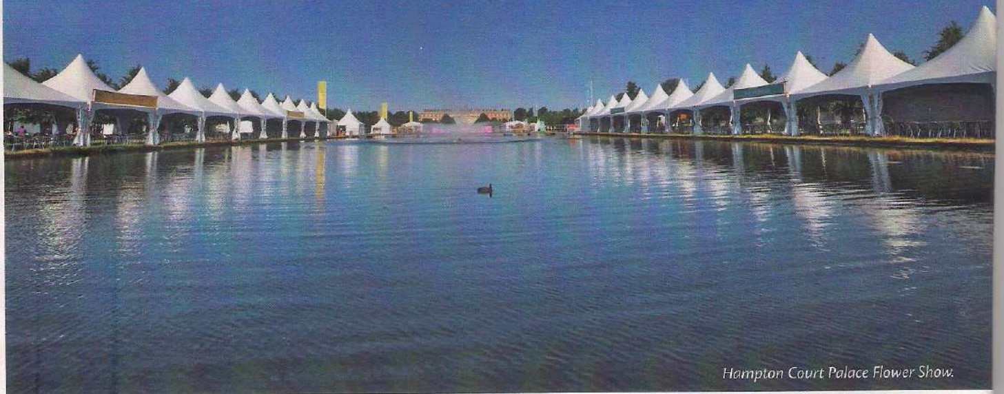
Hampton Court Palace Flower Show.

Obyvatelé největšího ostrova Evropy jsou posedlí zahradničením. Již dvě stě deset let se společnost Royal Horticultural Society (RHS) stará Britům o to, aby mohli každoročně zhlédnout přehlídky květin, zahrad, trávníků a rostlin.