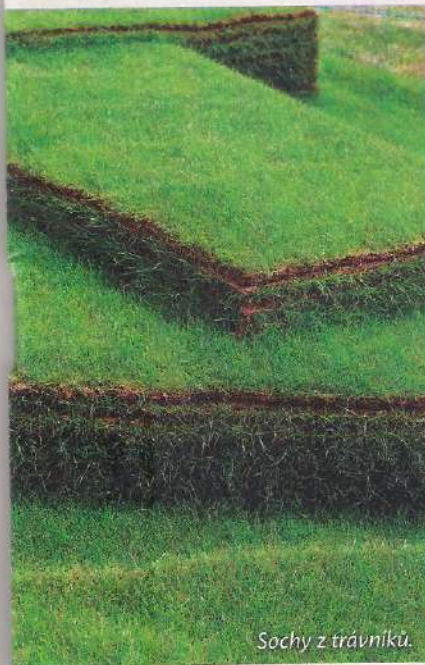
Sochy z trávníků.