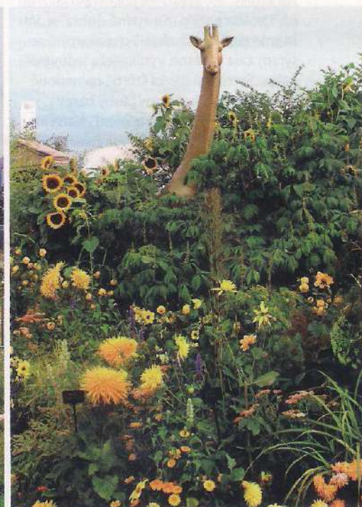
Část zahrady Británie v rozkvětu.